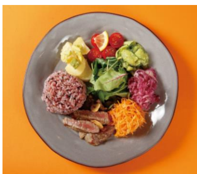
⑤ 牛フィレステーキの ワンプレート ¥1,836-