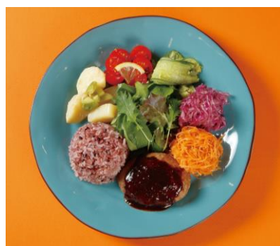
① 牛豚合挽ハンバーグの ワンプレート ¥1,080-