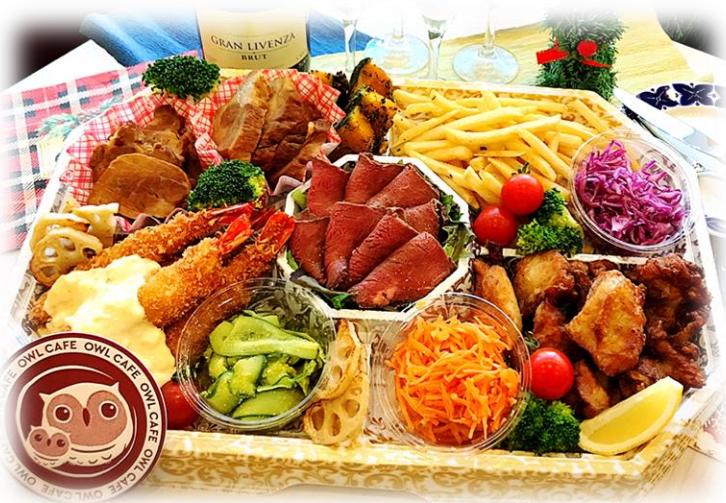
※写真は4人前になります

Hors d'oeuvre オールカフェ人気メニューがたくさん楽しめるオードブル! 当日予約OK!