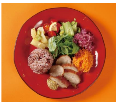
④ 豚のうま煮の ワンプレート ¥1,080-