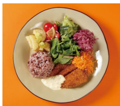
③ 白身魚フライ タルタルソースの ワンプレート ¥1,080-