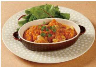
鶏のトマトソース煮 ¥972-

A la carte オールカフェで人気のオリジナル単品料理・ワンプレートのデリもテイクアウトOK!