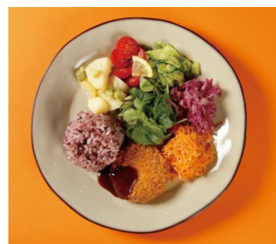
⑥ 大豆ミート5種の野菜のメンチカツ ワンプレート ¥1,080-